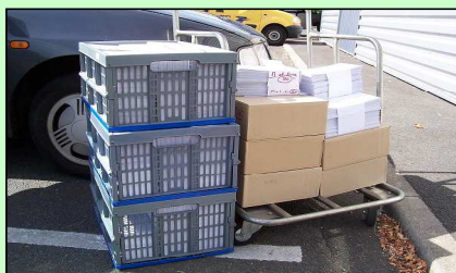
fin août 2005 : chaque caisse grise contient 1000 enveloppes, Les 2400 autres plis sont dans les cartons